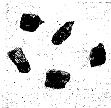
Рис. 1. Кристаллы тугариновита. Увел. 35.

Кристаллы исследуемого минерала темного лилово-коричневого цвета, призматического или толстотаблитчатого габитуса,