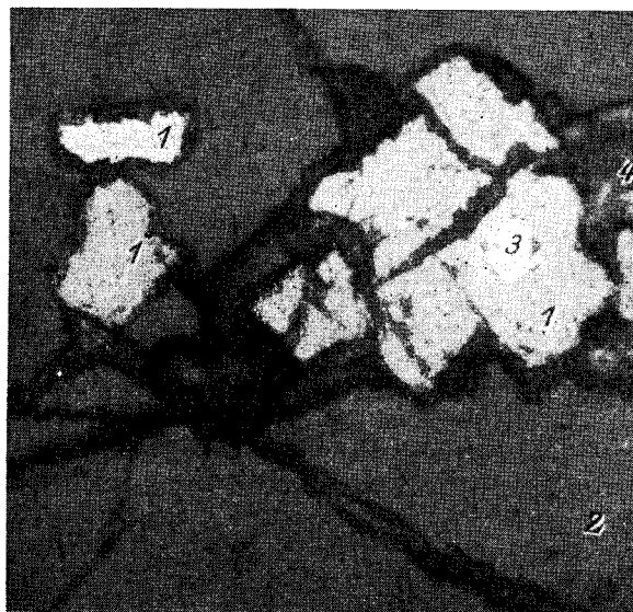
Рис. 2. Сроетки кристаллов тугариновита (1) в кварце (2). 3 — включение галенита, 4 — казолит, псевдоморфно замещающий уранинит. Прозрачно-полированный шлиф, отраженный свет, без анализатора, увел. 400.

Твердость минерала средняя, твердость микровдавливания 300 кгс/мм 2 (измерена в нескольких отпечатках на ПМТ-3, нагрузка в связи с неболь-