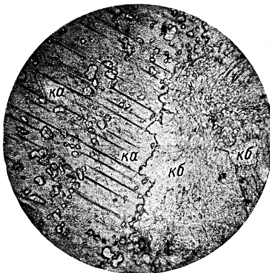
Рис. 2. Замещение кальцита (ка) кальциборитом (кб). (Николи паралл.; увел. 100).

Рентгенометрическое исследование фроловита было произведено Г. А. Сидоренко в рентгенометрической лаборатории ВИМСа. Съемка