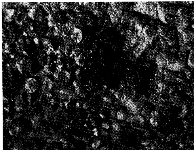
Рис. 2. Корочки бокита. В сколах отдельных почковидных образований видно их радиальнолучистое строение. (Увел. 24).

Под биноклем отдельные почковидные образования, а также корки и стяжения имеют внутреннее радиальнолучистое строение (рис. 2). В пу-